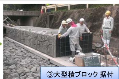
③大型積ブロック 据付