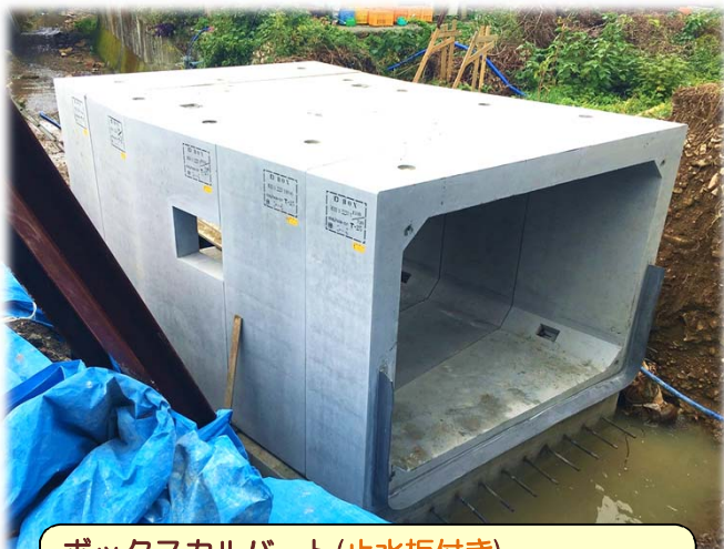
ボックスカルバート(止水板付き) 規格：W3000×H2200 施工延長：5m 事業主体：大洲河川国道事務所