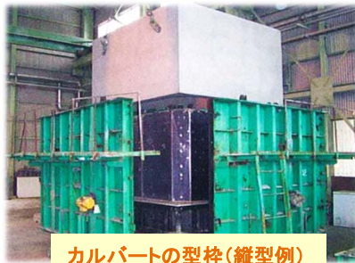
カルバートの型枠(縦型例)