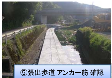
⑤張出歩道 アンカー筋 確認