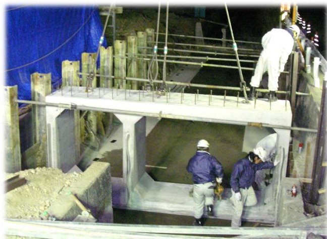
ボックスカルバート(2連式 止水板付き) 規格：W2250-1300×H1700 施工延長：19m×2箇所 事業主体：高知河川国道事務所