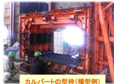
カルバートの型枠(横型例)

今回は、ボックスカルバートと現場打ち水路と接続する場合の止水処理事例をご紹介します。ボックスカルバートには凹凸のソケットがあり、場所打ちとの接合部での漏水が懸念されますが、製作方法を見直すことで止水板付きボックスカルバートを製作しました。