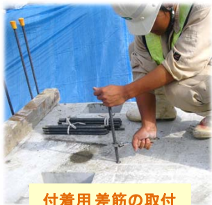
付着用 差筋の取付