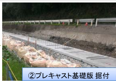
②プレキャスト基礎版 据付